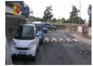
Messina, 11 arresti per spaccio di anabolizzanti Video