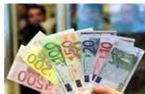
"Assunzioni illegittime nelle società partecipate"