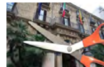
Pensioni, sconto governo-sindacati "Norme 'ammazza Sicilia'"