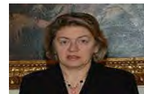
La Cgil attacca: "Irregolari le nomine dei dirigenti regionali"