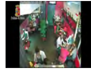
Ruba un cellulare incustodito Incastrato dalle telecamere