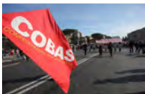
Manovra, Cobas: "Tagli ai regionali, ma aumenti per i gabinetti"