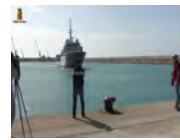
Sbarco a Pozzallo Arrestati tre presunti scafisti