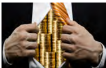
Dirigenti, i compensi da restituire e la sanatoria "salva-burocrati"