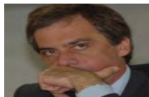
Venturi, Asi e Cantieri: "Ora stop alle clientele"