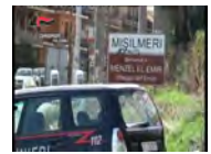
Misilmeri, l'incontro vittima-camefici prima della punizione della mafia - Il video