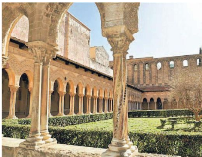
Il chiostro dei Benedettini a Monreale