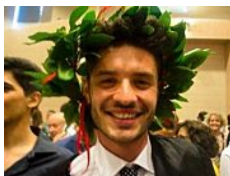
Giovane ucciso in discoteca, questore revoca licenza al «Goa»