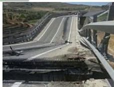
Crollo viadotto Scorciavacche, fioccano gli avvisi di garanzia