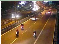
Corse clandestine con scooter sull'autostrada, 20 ragazzi denunciati

20 maggio 2015 | 11:54 © RIPRODUZIONE RISERVATA